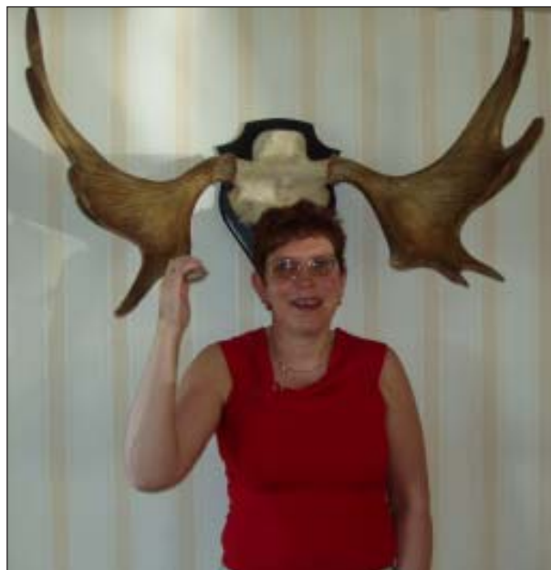
I 2003 stillede islandske Stefania op som model med det imponerende revir

Det ligner ved første øjekast en taber i hver farve, men selvfølgelig ikke med Pål ved roret. Øst stak med ♦E og spillede en lille spar til bordets ♠10. Spar igen tog Øst med esset og spillede en tredje omgang til håndens ♠D. På ♦KD forsvandt to af bordets hjerter, og nu brillerede Pål. Ingen finesse, men klør til ♣E fulgt af ♣K og mere klør til Østs ♣D. Stakkels Backas var slutspillet og måtte give hjerterfavør. Ti stik.