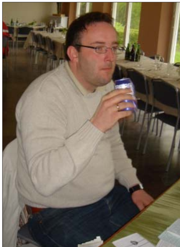
Der är Pep(s) i Bergs budgivning

Om man inte får klöver ut, blir spelet mer intressant – Syd måste maska i trumf för hemgång. Heja Norge!