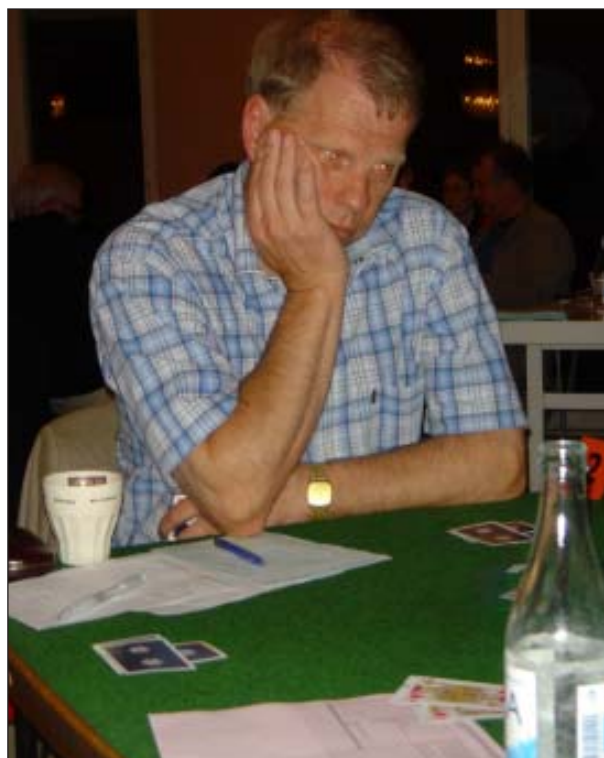
Kanske den storslam hjälper på min Butlare ...

Spelet var inte mycket att skriva hem om, men intressantare är hur en relativt enkel och rättfram budgivning leder till målet. 2♣ var fjärde färg och