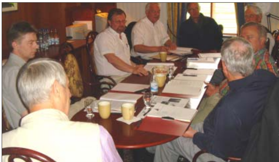
Fra NBU-mødet på Ominne