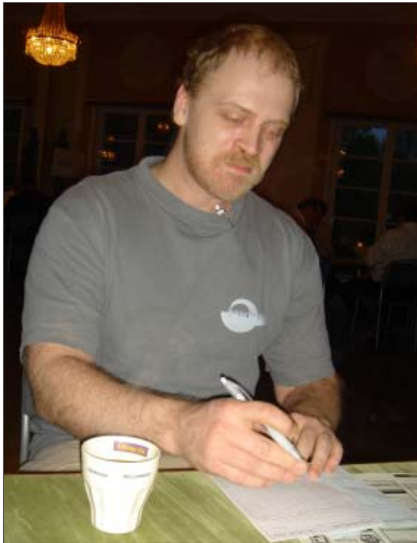
Hedin: „Fik jeg 10 stik, makker?“