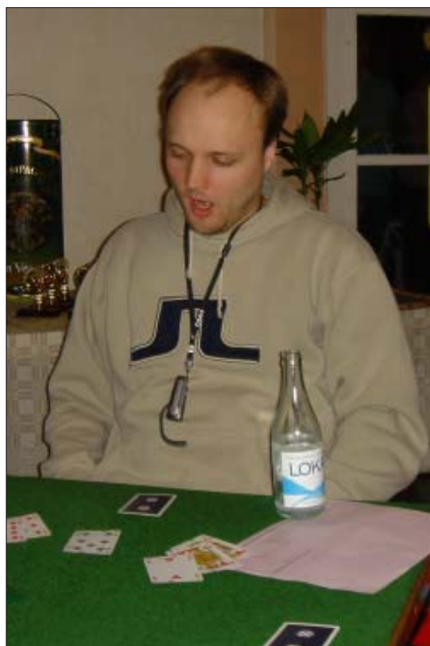
1400 gäspningar senare ...