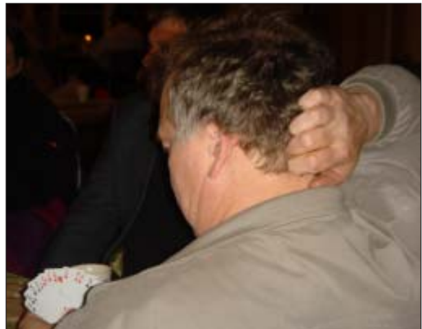
Thorlakur and Icerelay...