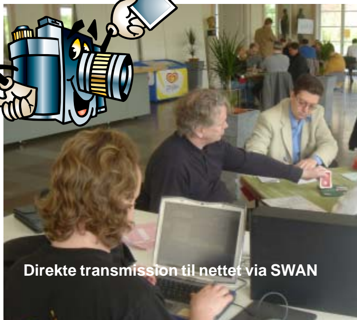
Direkte transmissjon til nettet via SWAN