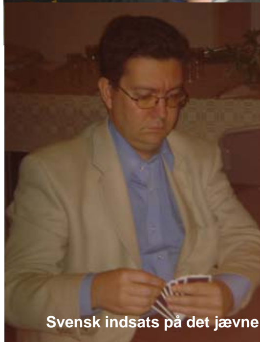
Svensk indsats på det jævne