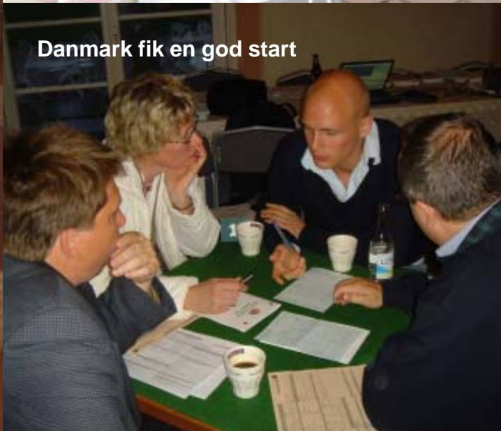
Danmark fik en god start