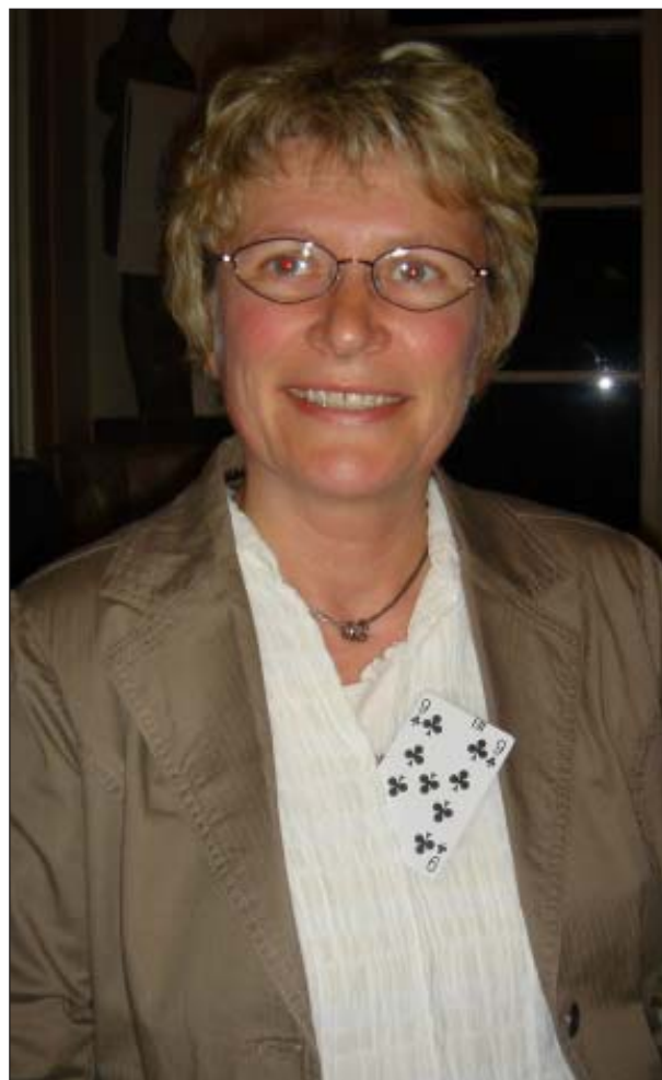
Nogle har esser i ærmet, men Dorthes ♣9 ...

I sidste spil i 2. runde var Dorthe i 6♠ med to faste tabere, ♦E og en klortaber med ♣E9 på bordet og ♣B10xxxx hjemme. Hvorfor give op? Dorthe spillede en lille klør til ♣9, der holdt stik! Mellemhånden, som også havde ♦E, havde lagt en lille klør fra ♣KDx.