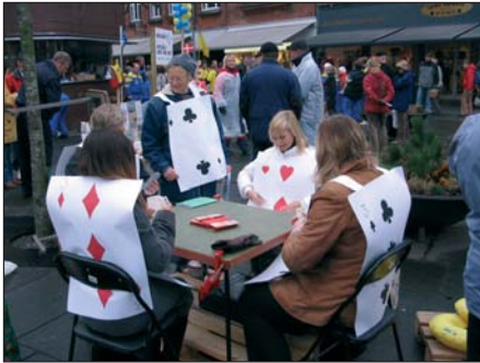
Livet var kort på gågaden