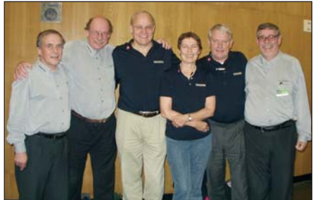
Seniorholdet – VM-bronze og EM-guld

Danmark vandt bronze ved Senior-VM i Estoril, Portugal. Et imponerende resultat, der naturligvis har fået behørig omtale i DANSK BRIDGE og på www.bridge.dk . Men hvorfor ikke bruge dette resultat og spillerne bag til et klubarrangement?