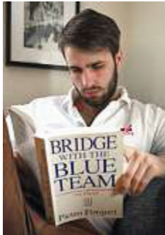
★ Den teoretiske ballast er en ikke uvæsentlig del af forberedelserne.

Jeg læser bridge-litteratur og ser live-kampe. Og vi har et junior-landsholdsforløb, hvor vi blandt andet har mentaltræ-