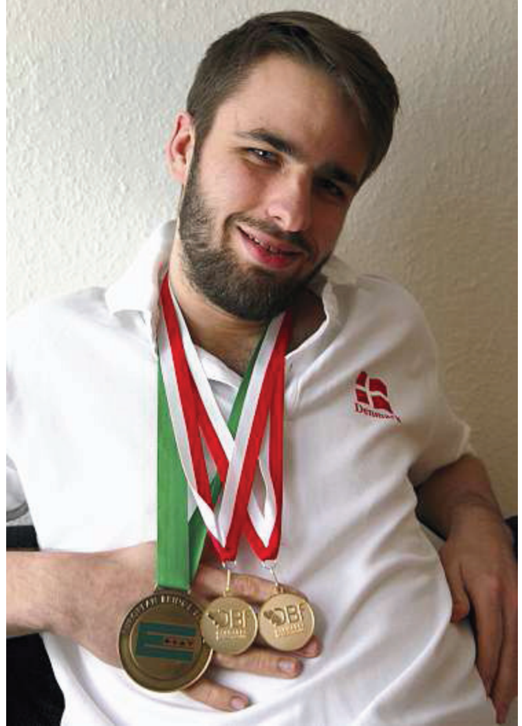
★ Lidt godt til halsen gør altid godt. Til venstre ses bronzemedaljen fra EM i Bulgarien.

- Hvis folk får blod på tanden, så tag kontakt til mig eller Bridgehuset. Vi gør meget i øje-