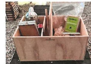
Der er plads til meget mere i værktøjskassen

Efter svaret 5ut er ny farve på 6-trinnet opfordring til storeslem og spørgsmål efter tredjeomgangs kontrol. Afslag er 6 i trumf.