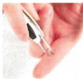
Splinter kan være godt

Hvis Svarer havde vist splinter i en anden farve, ♥ f.eks., skulle Åbner mere have taget pessimistiske briller på.